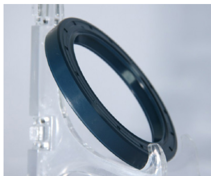
Abbildung 2: Standard Radialwellendichtung 12010969B ohne Rillen